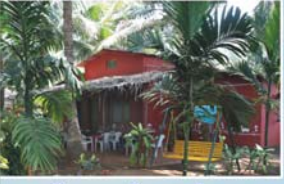
कृषी व ग्रामीण पर्यटन