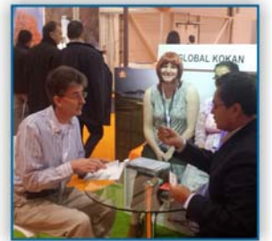
मॅंगो फेस्टीव्हल (लंडन) २०१३